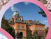
ตึกรัฐบาลเก่า