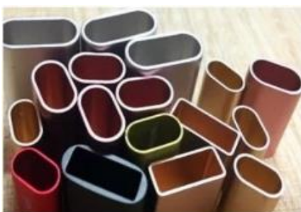
Metal Tube Cutting

เครื่องตัดเลเซอร์ไฟเบอร์แบบท่อโลหะที่ใช้กันอย่างแพร่หลายในเฟอร์นิเจอร์อุปกรณ์ทางการแพทย์อุปกรณ์ออกกำลังกายท่อน้ำมันอุปกรณ์นิทรรศการเครื่องจักรวิศวกรรมการผลิตรถบัสการผลิตจักรเครื่องจักรการเกษตรและป่าไม้ สะพานเรือชิ้นส่วนโครงสร้างการผลิตเครื่องใช้ในครัวเรือนและอุตสาหกรรมอื่น ๆ