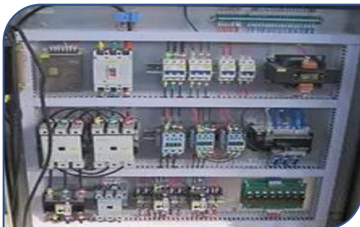
ชไนเดอร์ อิเล็กทริก จากฝรั่งเศส