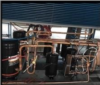
Air conditioning duct