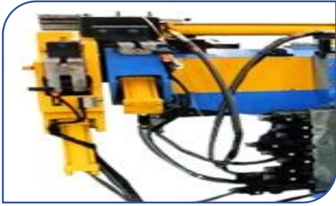
ท่อน้ำมันไฮดรอลิก